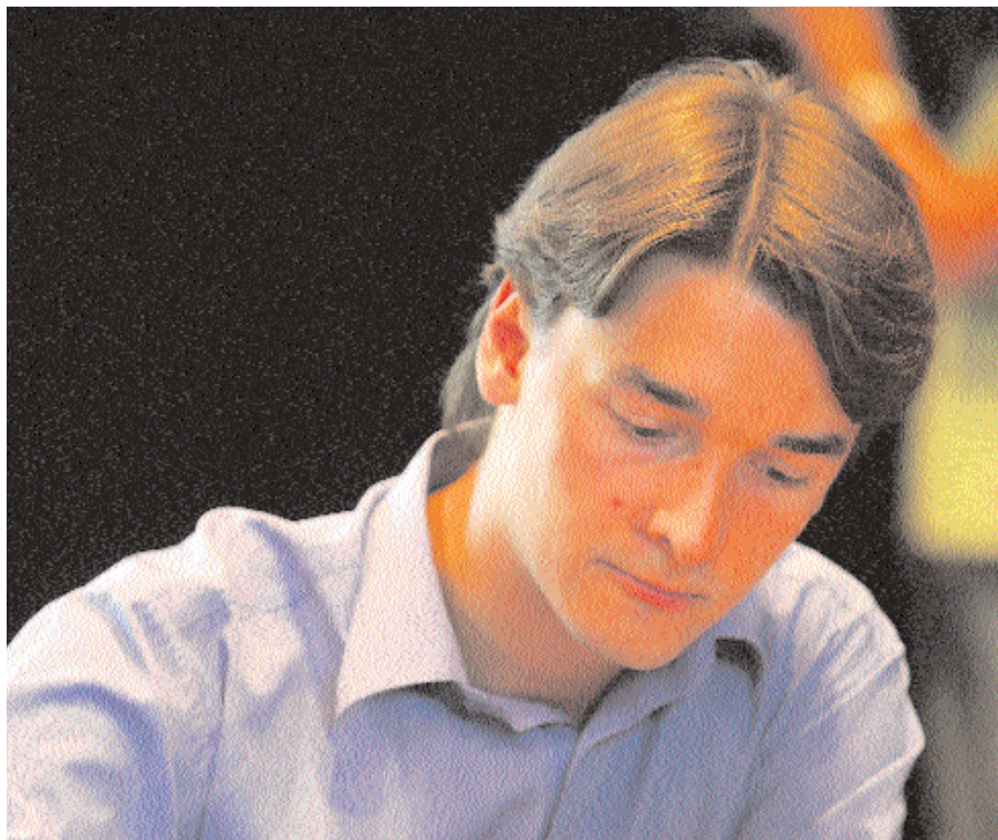
En s'imposant pour la 3e fois dans le tournoi des grands maîtres, à Bienne, Alexander Morozevich rejoint l'ex-champion du monde Anatoly Karpov.